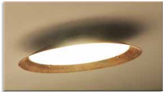
Ao lado, desenho da luminária dupla, aplicada sobre a mesa de bilhar. Acima, peça utilizada na sala de ginástica e na cozinha.

Cozinha, tratada com a combinação de luz natural e artificial.