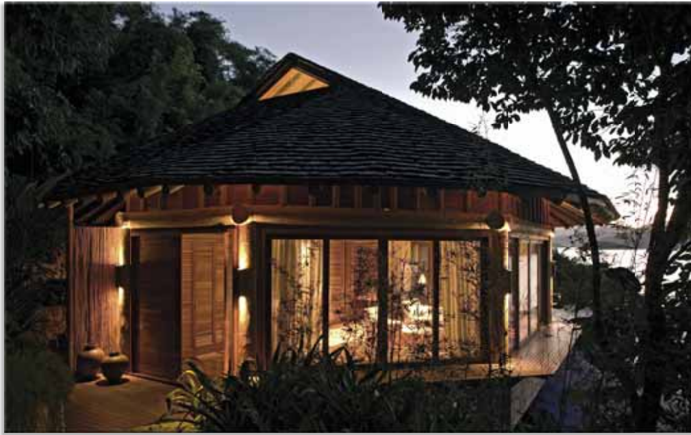
Fachadas do bangalô principal, realçadas com a luz de arandelas, instaladas nos pilares.

tada com a luz direta emitida por lâmpadas AR 70 de 50W/24°. No quarto, por spots fixados no forro com lâmpadas PAR 16 de 50W/40°, a 3000K, e abajures com lâmpadas incandescentes comuns de 60W postos sobre os criados-mudos.