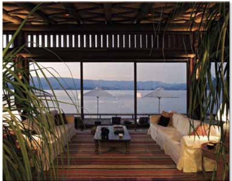
Sala de estar, iluminada, apenas, por quatro arandelas em forma de tulipa.

Já a varanda recebeu sequências de luminárias que acompanham o comprimento e a espessura das varetas de bambu que revestem o teto, equipadas com linhas de LEDs de 3W, por metro. O mesmo tipo de fonte de luz destaca os contornos do ofurô e o futon, que ficam um ao lado do outro.