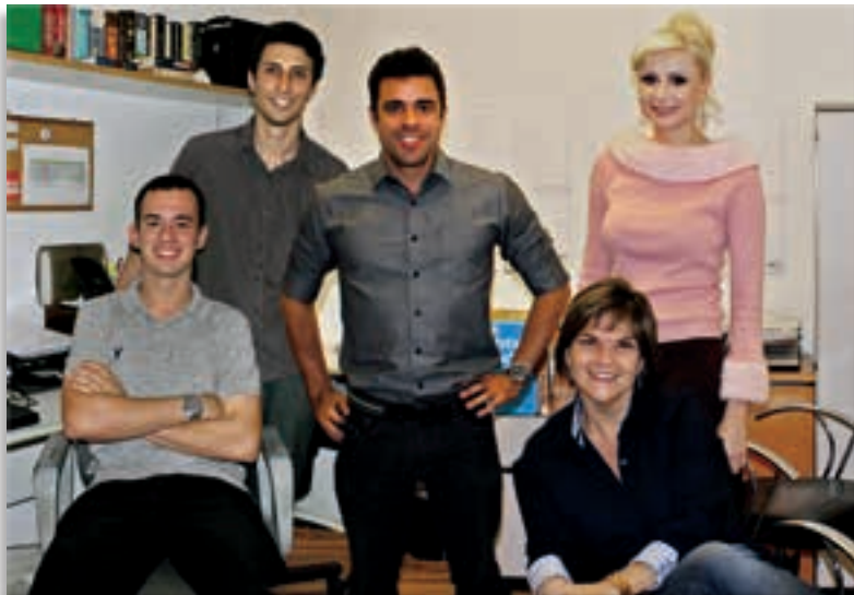
Equipe da NTZ Iluminação.

um projeto arquitetônico mais eficiente do ponto de vista energético e projetual.