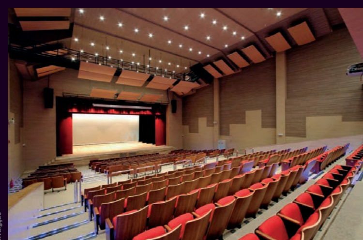
1 Sede da Revoluz, em Diadema (SP)