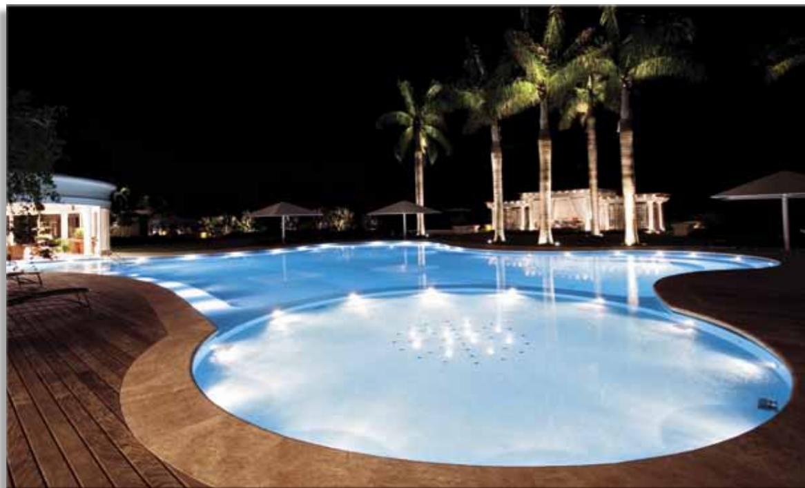
Piscina iluminada por halógenas a 3000K, e fibra ótica com efeito RGB no chafariz.

em larga escala, inclusive para todas as lâmpadas fluorescentes.