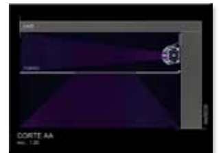
Corte esquemático AA: projetor afixado entre o forro de gesso e a laje da pista de dança.