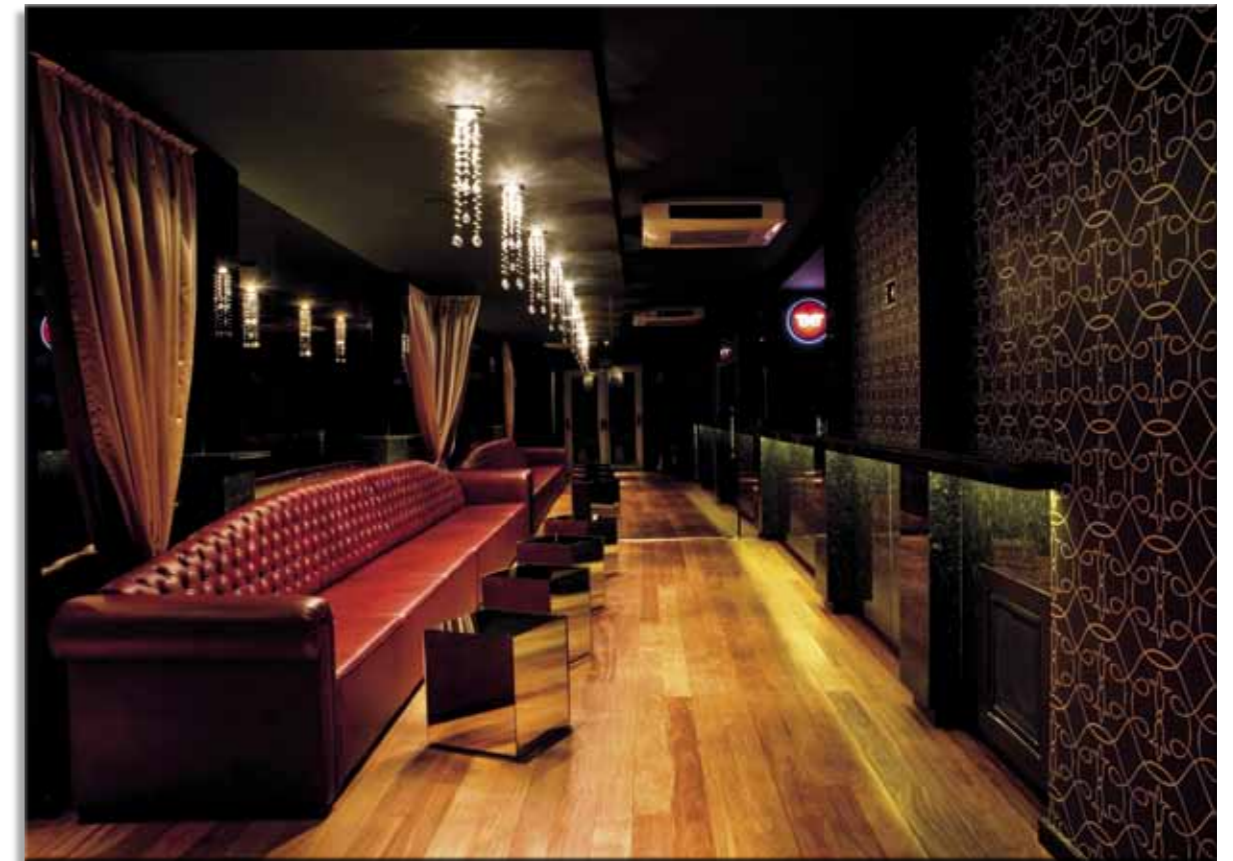
No lounge, sequência de lustres de cristal decora e fornece luz ambiental.