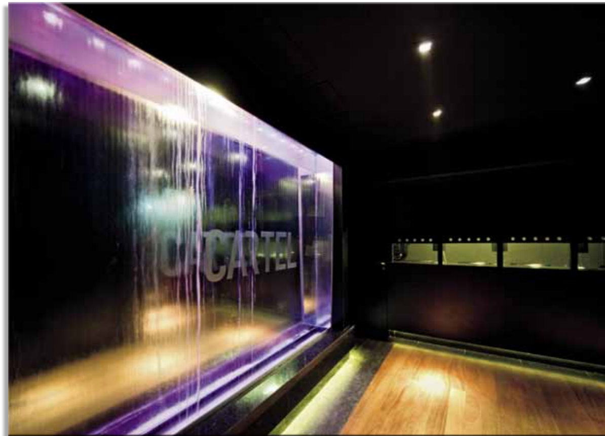
Acima, cascata realçada com a luz de LEDs em RGB, e caixa, que tem sua iluminação à prova de interferências. Abaixo, na fachada, luz colorida dissipada por cortes no revestimento de aço.

Os rodapés que se sobrepõem a esse painel e a frente do caixa, que fica mais adiante, são demarcados por fitas de LED de luz branca de 4W por metro, com 120° de abertura de fecho, a 3000K.