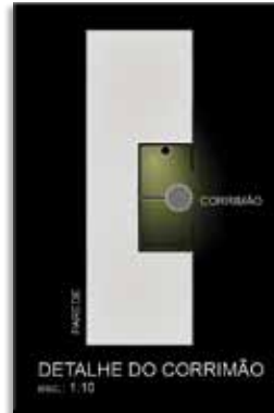
Detalhe do corrimão com uso de fita de LED em nichos contínuos balizando os dois lados da escada.

O interior da cabine de atendimento, que tem fechamento de vidro escuro para evitar interferência entre as iluminações externa e interna, é tratado com lâmpadas fluorescentes compactas de 18W, a 2700K, instaladas em luminárias embutidas no forro.