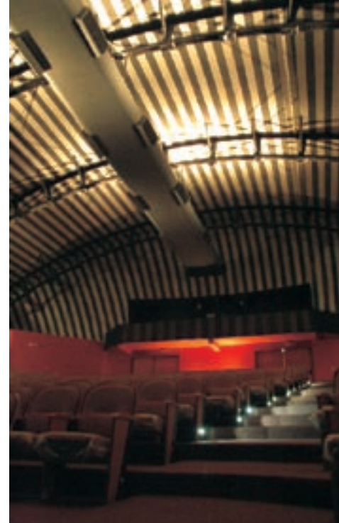
Lâmpadas halógenas 50W/8° de foco concentrado, instaladas na cobertura do teatro, realçam treliças de madeira.

No camarote, localizado na lateral esquerda do teatro, o balizamento foi feito com luminárias