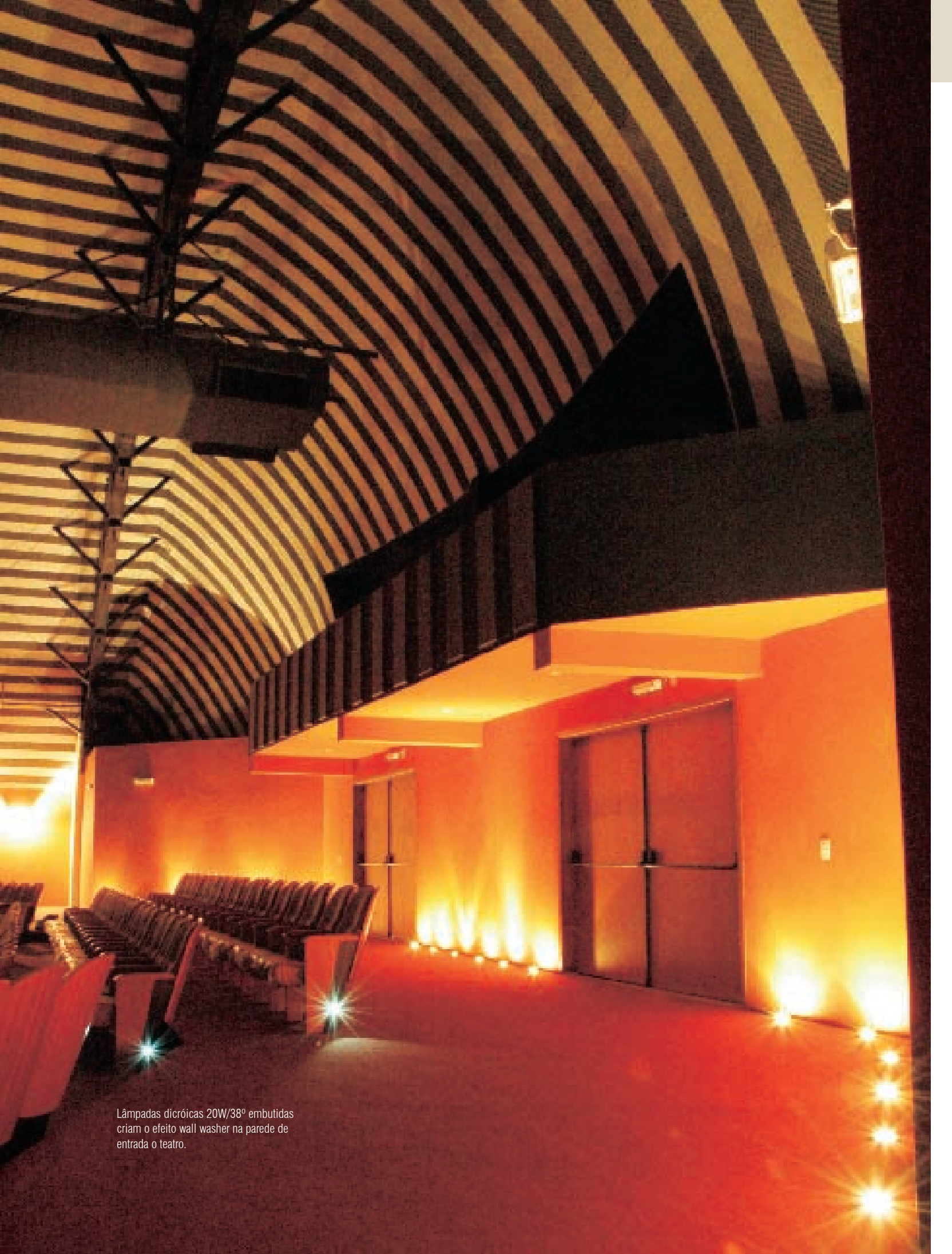
Lâmpadas dicróicas 20W/38° embutidas criam o efeito wall washer na parede de entrada o teatro.