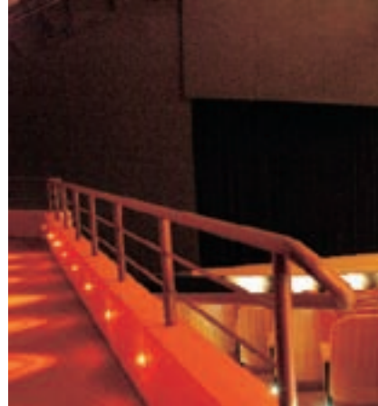
LEDs fazem o balizamento da escadaria(esq.). Acima, eles marcam o parapeito do camarote.