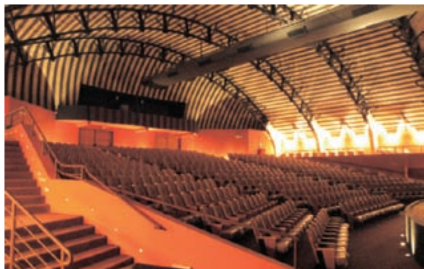
Vista da escadaria, com balizamento feito com LEDs amarelos.

palco, que é pintada de preto, recebeu uma iluminação embutida uplight, com lâmpadas halógenas halopim de 20W, 3000K, gerando contrastes e chamando a atenção do público para o espaço. ◀