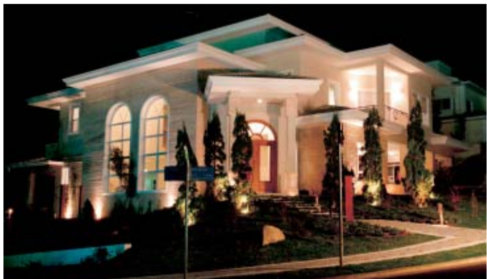
Lateral esquerda com luminárias blindadas no jardim e lateral direita com postinhos.

A iluminação resultante deste espaço ressaltou os elementos decorativos dispostos no deck: um vaso e a esfera de cerâmica esmaltada, de cor vinho. "Buscamos uma combinação - digamos - 'artística' nesse ponto específico, mostrando o brilho dos objetos decorativos como uma mesa de vidro, com um vaso de cerâmica esmaltada azul, localizada logo ao lado da piscina", explica Marta. "A iluminação de tom azulado, vinda de dentro da piscina, tam-