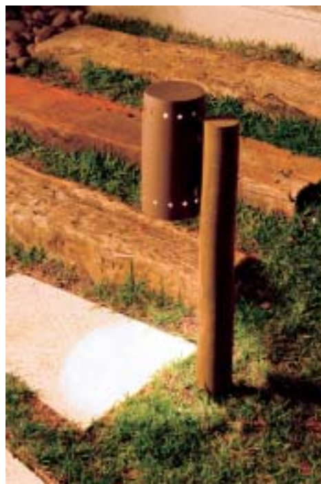
A luminária em formato de cilindro concentra a iluminação.