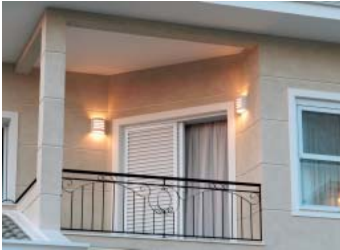
Arandelas reforçam a decoração da varanda superior.

Na área externa frontal da casa há um jardim composto basicamente de pinheiros. Nas bases dessas árvores foram instaladas luminárias embutidas metálicas, não aparentes, com lâmpadas PAR 38, direcionando a iluminação de baixo para cima.