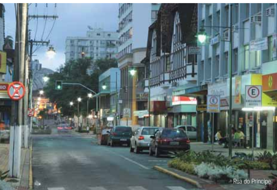
Rua do Príncipe