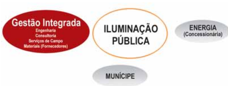
Figura 1: Esquema do modelo de gestão integrada da Iluminação Pública.

Gestão Integrada implica a contratação, pelas prefeituras, de uma empresa especializada ou de um consórcio de empresas, com profissionais qualificados, que opera como gestor da iluminação pública.