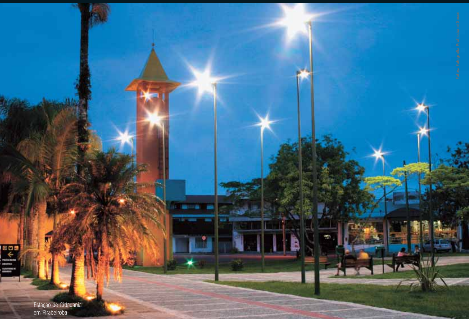
Estação de Cidadania em Pirabeiroba