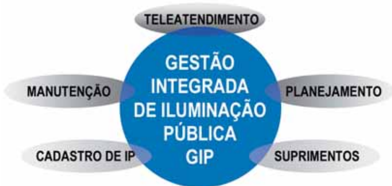
Figura 2: Módulos funcionais da gestão integrada de Iluminação Pública

Desde o início da implantação do novo modelo até o presente, muitos trabalhos já foram executados, principalmente no que diz respeito à atualização do cadastro do parque de IP, à criação de novos padrões de equipamentos e materiais, ao tratamento dos materiais nocivos retirados da rede, sem contar os serviços de manutenção, ampliação e remodelação (eficiência energética na iluminação de avenidas e praças). Alguns importantes projetos já foram ou estão sendo