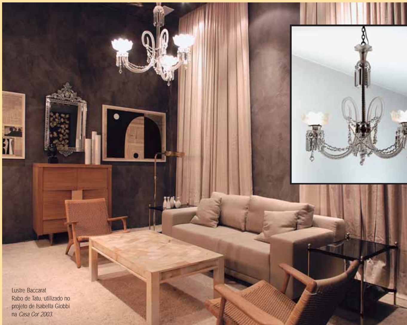
Lustre Baccarat Rabo de Tatu, utilizado no projeto de Isabella Giobbi na Casa Cor 2003 .

Costumo dizer que a compra de um lustre é definida pelo amor à peça. Pode começar com uma paquera, que em alguns casos leva até anos, ou ser aquela típica paixão arrebatadora que a pessoa vê e compra na hora.