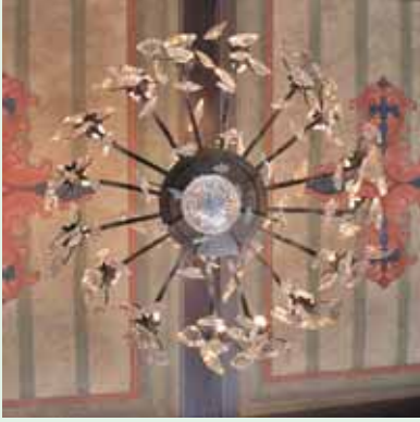
Casa Cor 2004 - Pórtico de Entrada Arquitetos: Aieto Manetti, Anna Baglioni e Fernanda Azevedo Lustre: Began Antiquidades