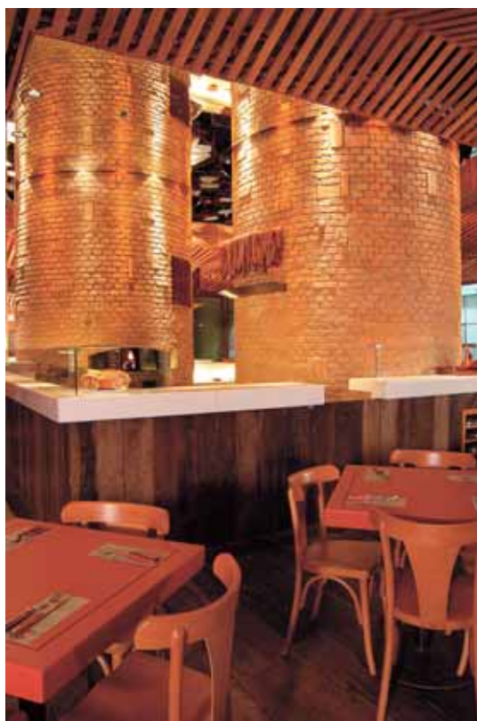
A fonte luminosa no topo dos fornos não fica visível, porque o recuo do espelho e as luminárias foram pintados de preto.