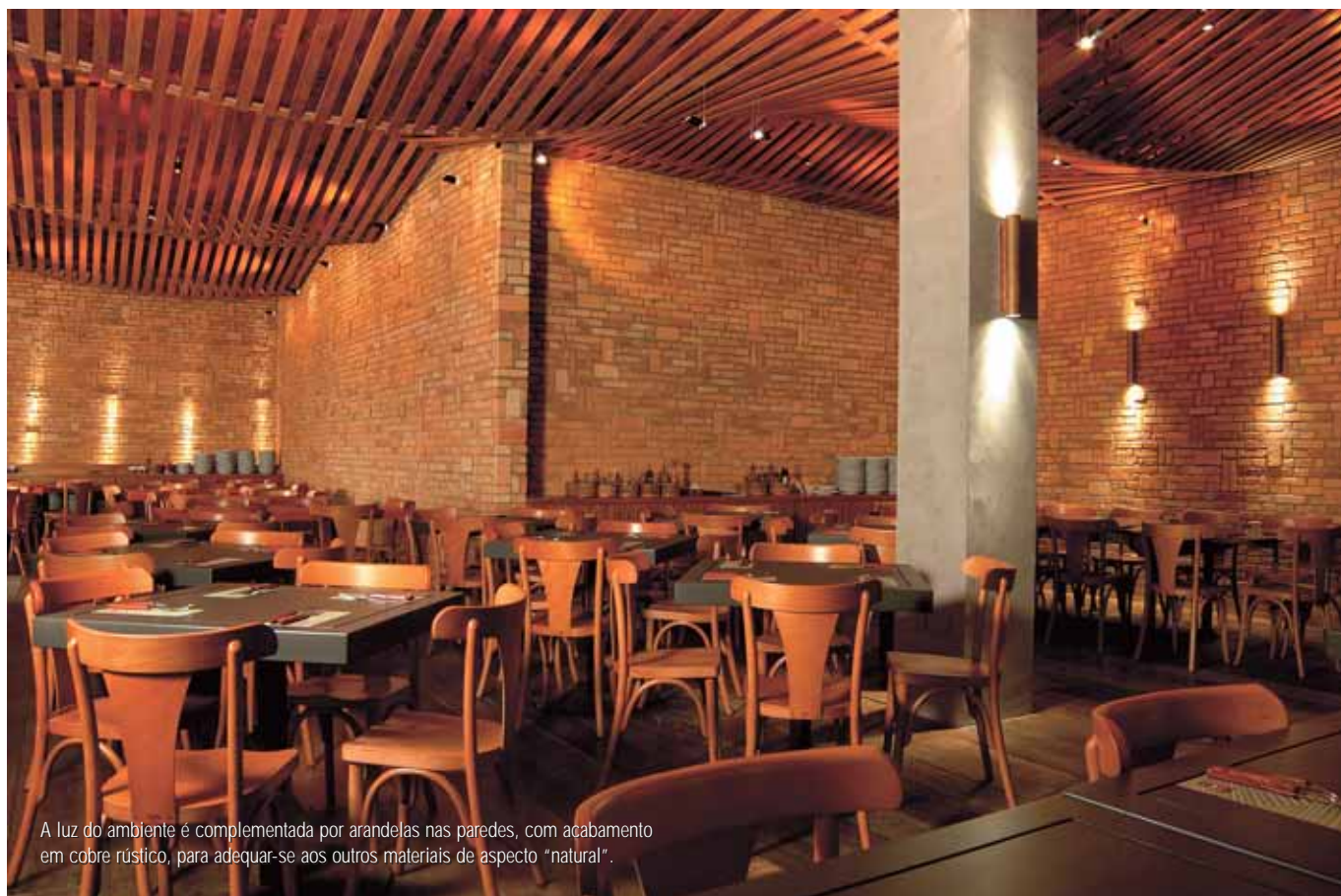
A luz do ambiente é complementada por arandelas nas paredes, com acabamento em cobre rústico, para adequar-se aos outros materiais de aspecto "natural".